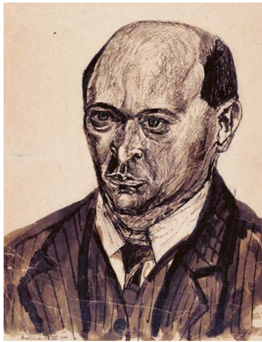
Arnold Schönberg, Selbstporträt, 1908

In Spanien entstand die Sarabande, ein getragener Schreittanz, dessen gravitatischen Charakter Bach jedoch mit bezaubernden Verzierungen auflichtet. Die beiden folgenden Menuette verraten unschwer den Ursprung dieses eleganten höfischen Tanzes, der sich vom französischen »menu pas«, also dem »kleinen, zierlichen Schritt«, herleitet. Federleicht und erdenthoben klingt, was Bach in der Partita daraus macht. Das virtuose Finale bildet eine Gigue, deren Urahn der britische Jig war, ein schneller pantomimischer Tanz, zuweilen mit clownesken Einfällen garniert. Und wieder zeigt sich Bach ganz auf der Höhe seiner Zeit, verlangt er hier doch das akrobatische Überkreuzen der Hände, wie es sein französischer Kollege Jean-Philippe Rameau gerade in seinem Stück »Les Cyclopes« entwickelt hatte. Bach widmete seine sechs Partiten »denen Liebhabern zur Gemüths-Ergoetzung«. Wer sie meistern will, muss im Klavierspiel allerdings schon recht weit fortgeschritten sein.