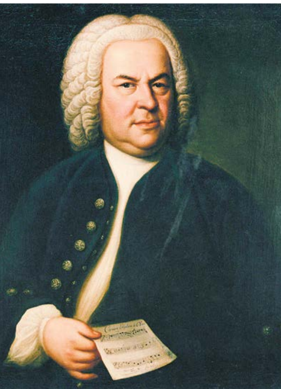
Johann Sebastian Bach, 1746

Johann Sebastian Bach galt als einer der besten Tastenvirtuosen seiner Zeit: Man pilgerte von weit her nach Weimar, Köthen oder Leipzig, um ihn auf der Orgel und am Cembalo zu hören. Doch genügte es Bach nicht, sich in seiner eigenen Kunst zu sonnen; er war auch vom Ehrgeiz beflügelt, seine Erkenntnisse weiterzugeben an die nachfolgende Generation und alle, die selbst gern musizierten. Als Thomaskantor in Leipzig, wo er von 1723 bis zu seinem Tod im Jahr 1750 wirkte, gehörte es zu seinem täglichen Brot, an der Thomasschule Musikunterricht zu erteilen. Auch zuvor schon hatte er etliche Werke komponiert, die dem Selbststudium und der pianistischen Schulung dienten, wie etwa die Inventionen und Sinfonien oder »Das wohltemperierte Klavier«. In Leipzig aber nahm er ein regelrechtes Großprojekt in Angriff, seine »Clavier Übung«, die er in vier Teile gliederte, welche die Sechs Partiten für Cembalo, die »Französische Ouvertüre«, das »Italienische Konzert«, eine Vielzahl von Orgelwerken und die »Goldberg-Variationen« beinhalten.