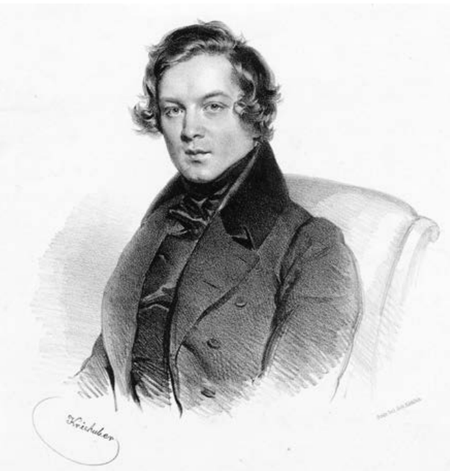
Robert Schumann, 1839