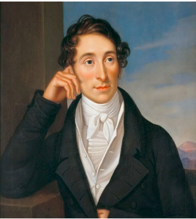
Carl Maria von Weber

Im Carl-Maria-von-Weber-Jahr (sein Todestag jährt sich 2026 zum 200. Mal) darf natürlich auch dieser Tonkünstler im Programm nicht fehlen, umso mehr, als Weber eng mit Dresden verbunden war, viele seiner Werke dort entstanden sind und sein künstlerisches Schaffen in der Stadt nachhaltige Spuren hinterlassen hat. Das Sommerhaus, das heute auch das Weber-Museum beherbergt, steht ganz in der Nähe von Pillnitz. Das erste Werk, das neben dem »Jägerchor« aus der Oper »Der Freischütz« bei der heutigen Serenade von Carl Maria von Weber erklingt, ist ein Chorlied aus der Musik, die er zu dem am 14. März 1821 uraufgeführten Schauspiel »Preciosa« von Pius Alexander Wolff schrieb, einem in Augsburg geborenen Schauspieler, Dramatiker und Regisseur.