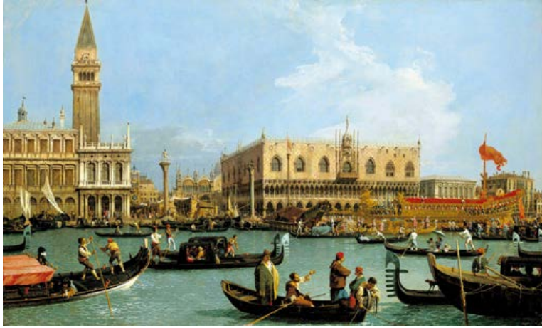
Canaletto: Venedig, 1732