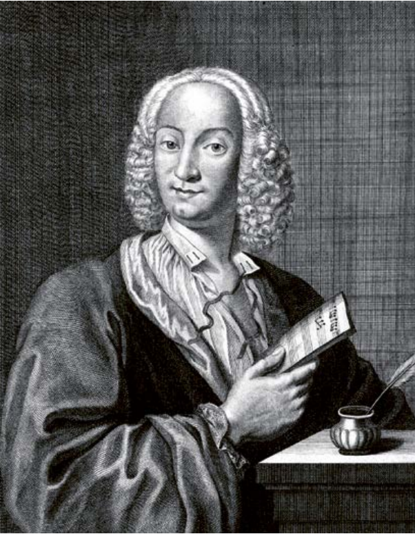
Antonio Vivaldi, 1725