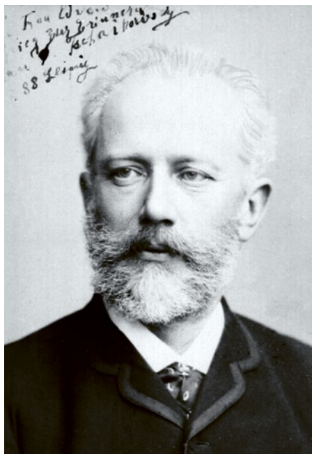
Peter Tschaikowsky, 1888

Peter Tschaikowskys »Souvenir de Florence« ist eine leidenschaftliche Liebeserklärung an Italien. Der russische Komponist schrieb sein einziges