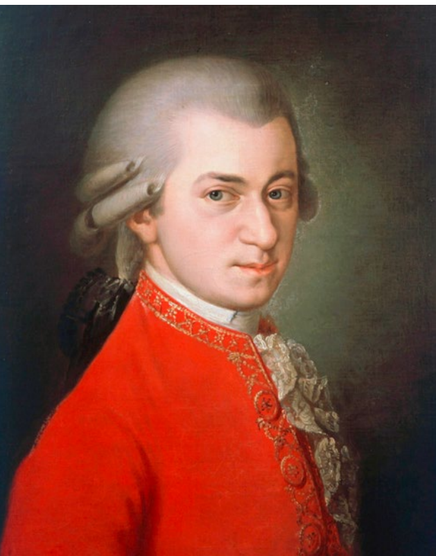
Wolfgang Amadeus Mozart

Wien beauftragt – schafften die besten Voraussetzungen für die Wandlung zum ernst zu nehmenden Tonschöpfer. Und Mailand klopfte bereits mit einer weiteren Anfrage für eine neue Oper in der kommenden Saison an. Vom Glück der frühen Erfolge beflügelt, flossen Mozart wieder daheim in Salzburg zu Beginn des Jahres 1772 die drei Divertimenti KV 136–138 aus der Feder, die sich von den Klangeindrücken der zweiten Italienreise inspiriert zeigen. Von spritziger Leichtigkeit und südländischer Lebensfreude sind sie kurzweilige Unterhaltungsmusik im besten Sinne und wohl gleichzeitig auch eine kompositorische Visitenkarte für den neuen Dienstherrn Fürsterzbischof Hieronymus Graf Colloredo, der in Hofkonzerten bei Gelegenheit gar selbst am ersten Pult der Violinen zu spielen pflegte. Vielleicht mit Blick auf diese Vorliebe agieren die Violinen auch fast durchgängig als Melodiengeber, wobei die Bratschen und Celli eher auf eine Be-